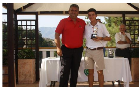
Cpto. de Andalucía Sub-25