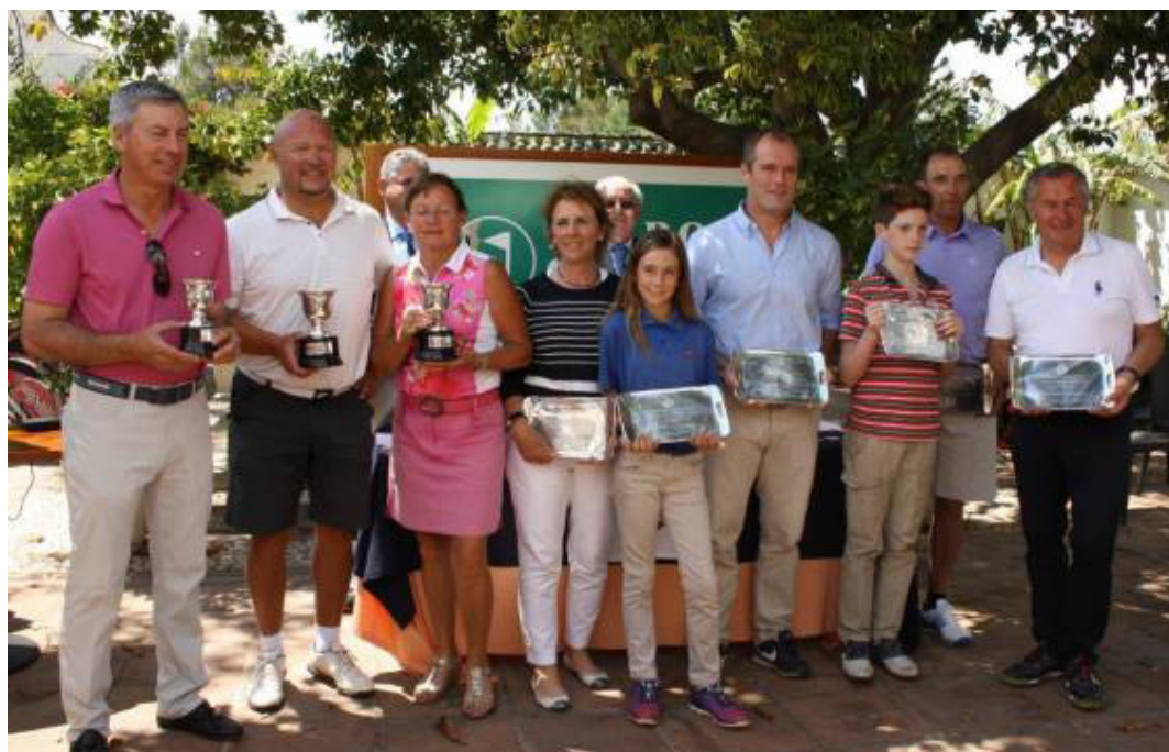
Cpto. Internacional de Andalucía 3ª y 4ª Categoría Lauro Golf