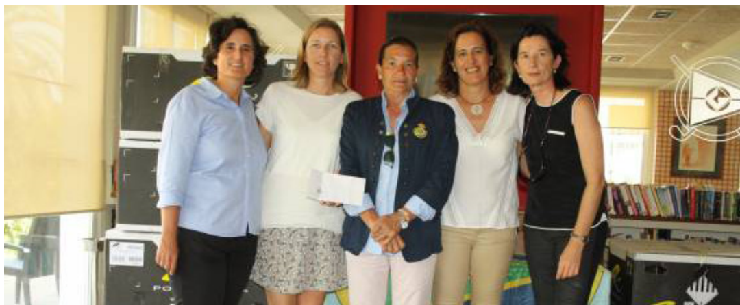
Campeonas-Final Circuito Femenino