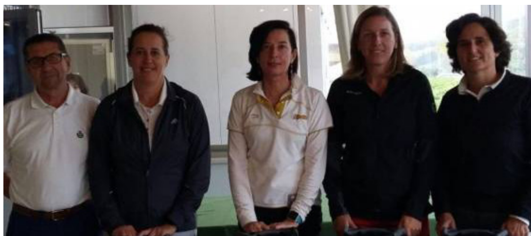
Campeonas Circuito Doña Julia