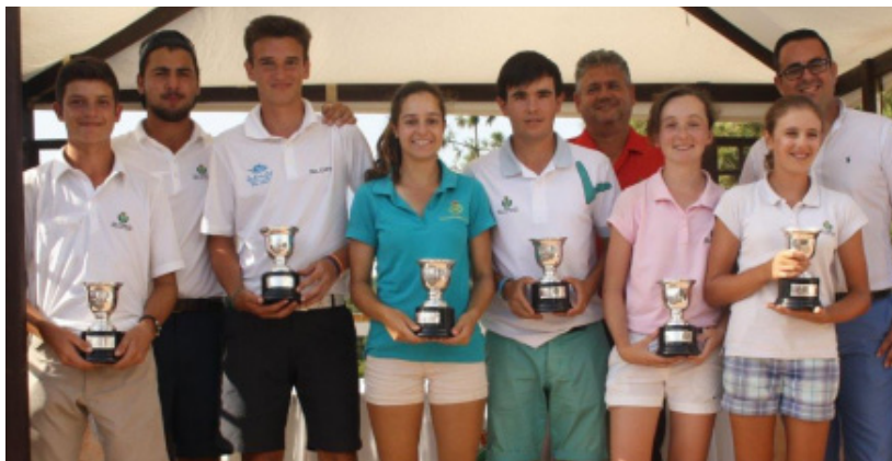
Cpto. de Andalucía Sub-25