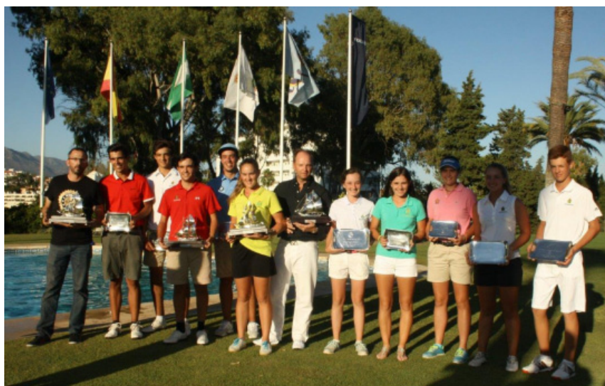
Memorial Norberto Goizueta