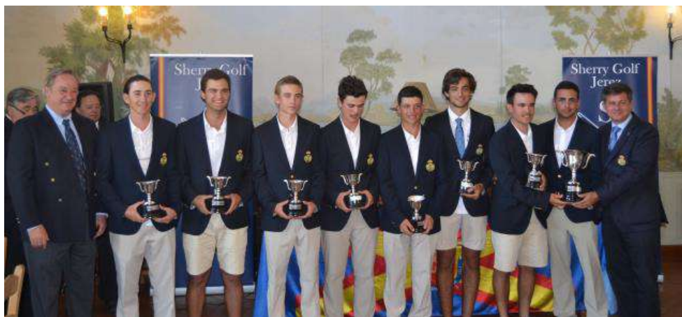
Interautonómico Sub-18 Sherry Golf-Campeones

Andalucía supera a Cataluña en la final y se proclama Campeona.