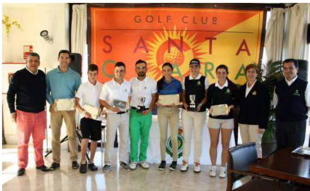
Puntuable de Granada Primeros clasificados

Recibieron subvención por parte de la Real Federación Andaluza, los seis primeros clasificados.