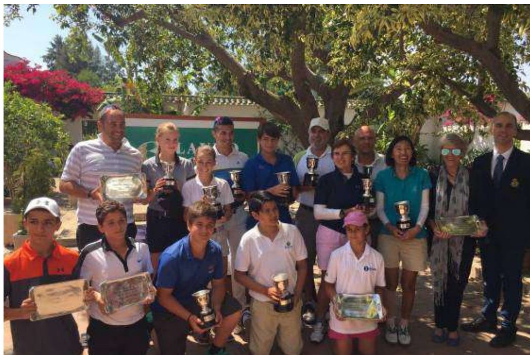
Cpto. Internacional de Andalucía 2ª 3ª y 4ª categoría Lauro Golf