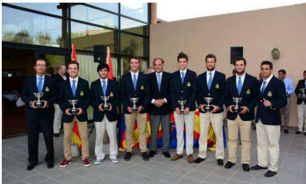
Cpto. Interautonómico Absoluto Masculino Subcampeones

Finalmente Andalucía se proclama Sucampeona, vencida por Cataluña por 4 a 3.