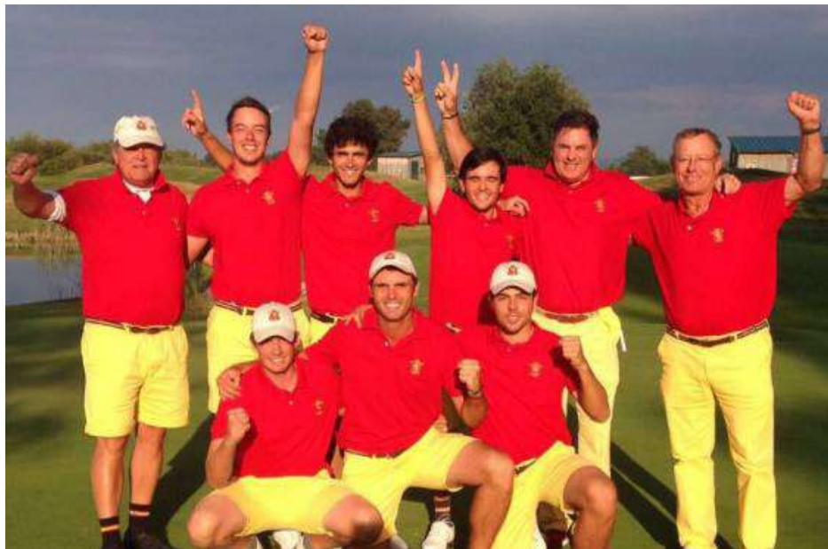
Cpto. de Europa Absoluto Masculino por equipos Campeones

Finalmente, España se proclama Campeona, superando a Inglaterra por 4 a 3.