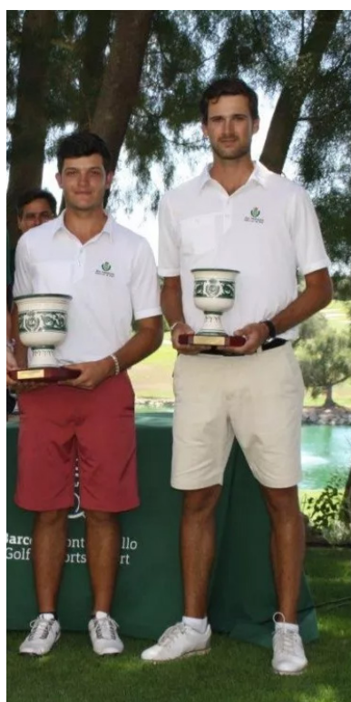
Cpto. Internacional Individual de Andalucía Montecastillo Campeón y Subcampeón

Recibieron subvención de la RFGA los seis primeros clasificados.