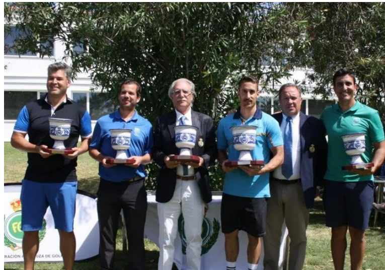
Interclubes Masculino de Andalucía Campeones-Club de Golf Bellavista

CAMPEONATO NACIONAL INDIVIDUAL DE ESPAÑA MAYORES DE 30 AÑOS MASCULINO: Celebrado en el Real Golf de Pedreña, del 24 al 26 de Mayo. Participaron un total de 73 jugadores, siendo los resultados obtenidos por los andaluces en la última jornada, los siguientes: