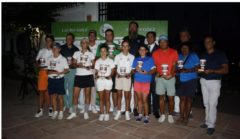
Cpto. Andalucía 2ª, 3ª y 4ª Categoría Lauro Golf