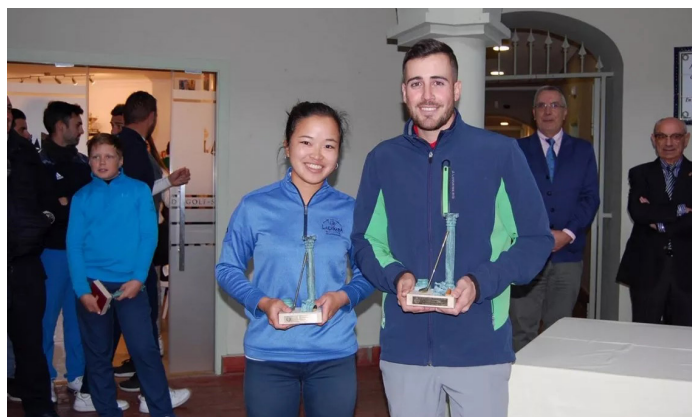
Trofeo Barbesula Campeones