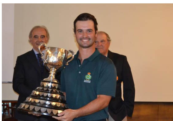
Copa Nacional Puerta de Hierro Pedro Marín