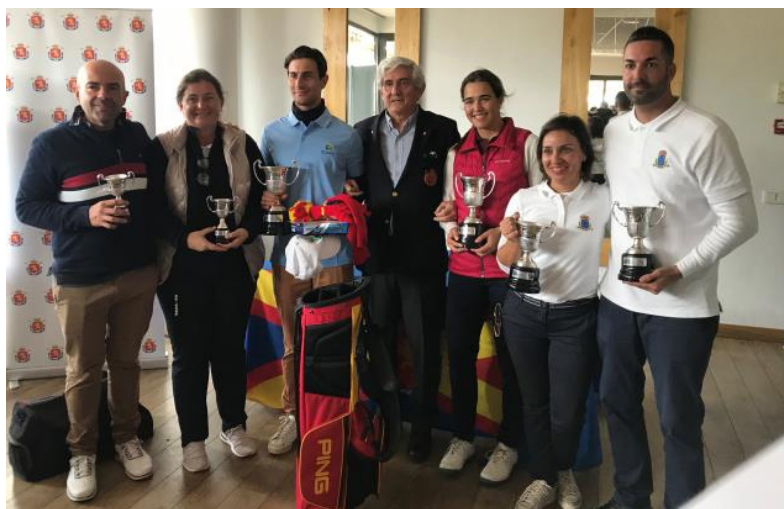
Gran Final Circuito Nacional de Golf 5ª Categoría

Don Gonzaga Escuriaza, Presidente de la RFEA, apoyó con su presencia esta Gran Final, entregando al termino de la ronda Stableford, los premios correspondientes a los ganadores. En categoría masculina, entre los mejores, destacamos al andaluz Juan Núñez (39 puntos).