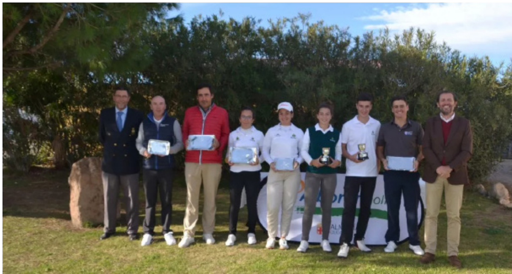
Puntuable de Almería (Alborán Golf) Primeros clasificados

Recibieron subvención de la RFGA, los seis primeros clasificados.