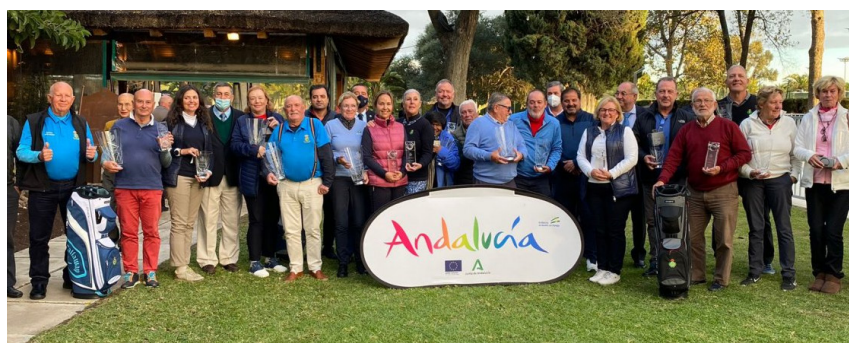
FINAL CIRCUITO SENIORS R.C.PINEDA