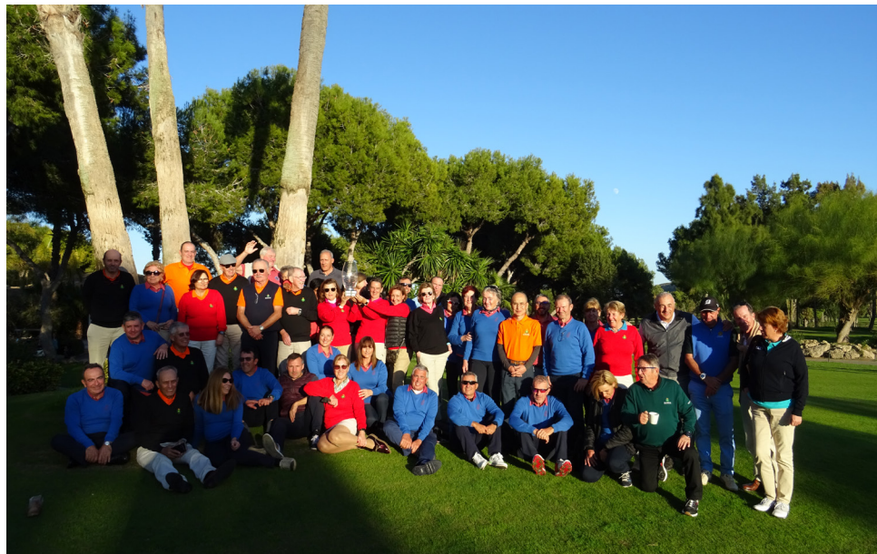
Match Valencia VS Andalucía Foto grupo