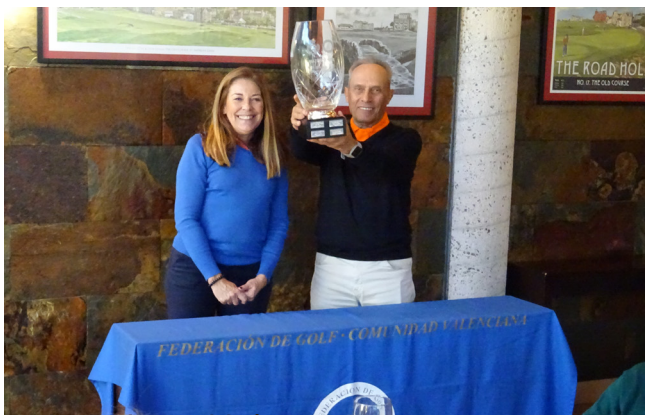
Match Valencia VS Andalucía