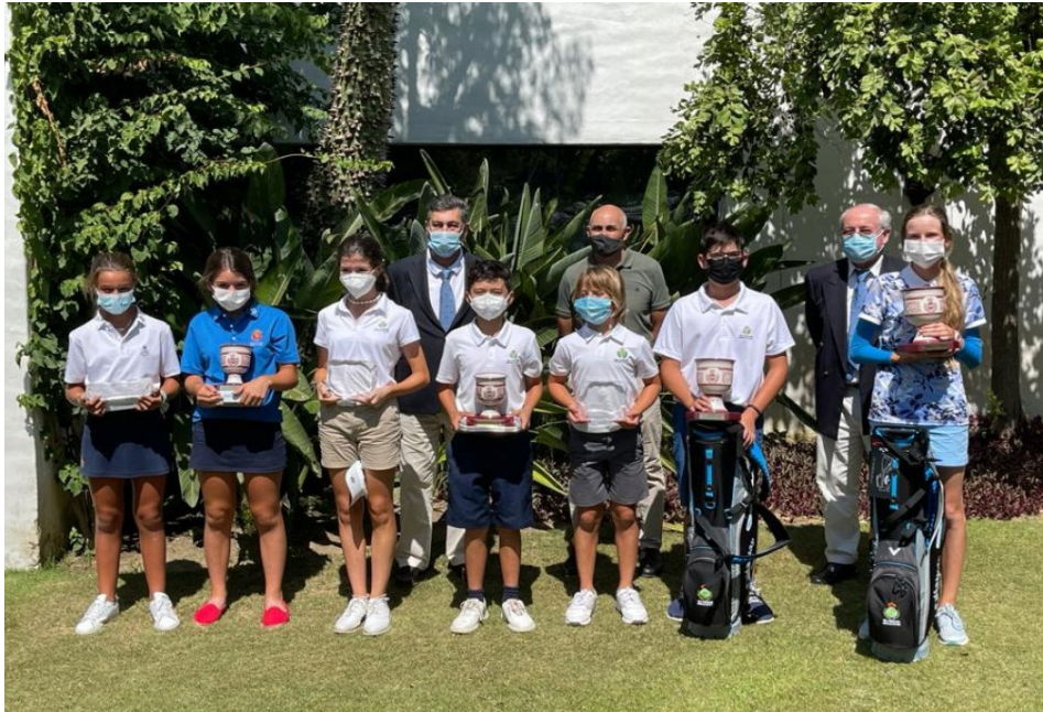
Campeonato de Andalucía Sub-16 de P&P

No se celebró Campeonato Benjamín por falta de participantes.