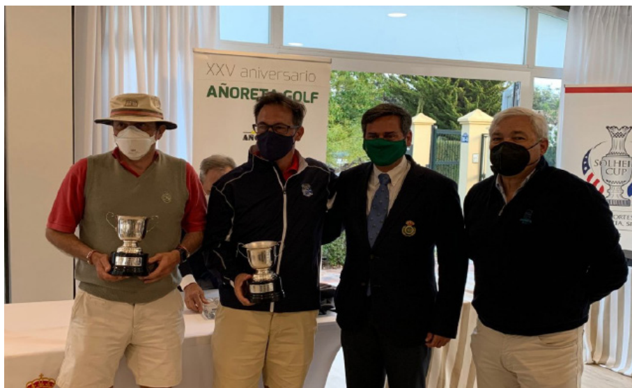
Cpto. Internacional Andalucía Dobles Senior Añoreta Golf Campeones

CAMPEONATO DE ANDALUCIA SENIORS: Celebrado los días 1 y 2 de Mayo en Golf Isla Canela. Las clasificaciones fueron las siguientes por categorías: