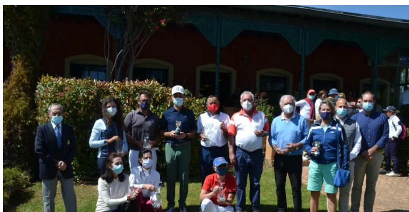
Cto. Seniors de Andalucía Isla Canela Golf