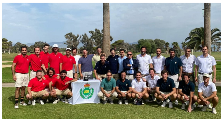
Match Cuadrangular El Parador de Málaga de Golf

II MATCH CUADRANGULAR MID-AMATEUR: Celebrado en el Parador de Málaga de Golf, los días 22 y 23 de Octubre, los combinados que representaban a Cataluña, Madrid, País Vasco y Andalucía se enfrentaron en modalidad Match Play. Un torneo de dos jornadas de competición en el que la victoria final fue para el cuadro catalán, imponiéndose al equipo de Andalucía en la gran final.