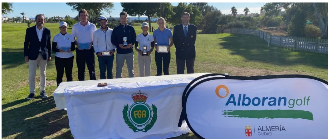
Ciudad de Almería Alborán Golf Primeros Clasificados