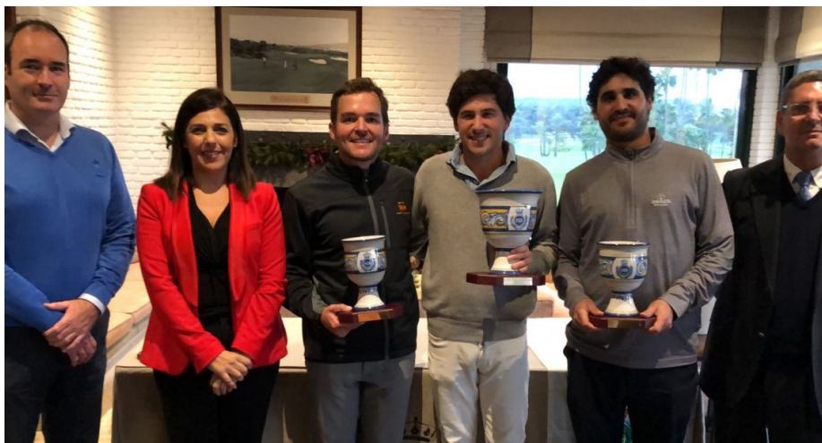
CTO. ANDALUCÍA MID AMATEUR R.C.G. SOTOGRANDE PRIMERS CLASIFICADOS

Este Campeonato se tendrá en cuenta para que el próximo año, el Campeón y Subcampeón, reciban una subvención para el Campeonato de España Mid Amateur. Así mismo, también recibirán subvención los dos mejores jugadores del Ranking Andaluz.