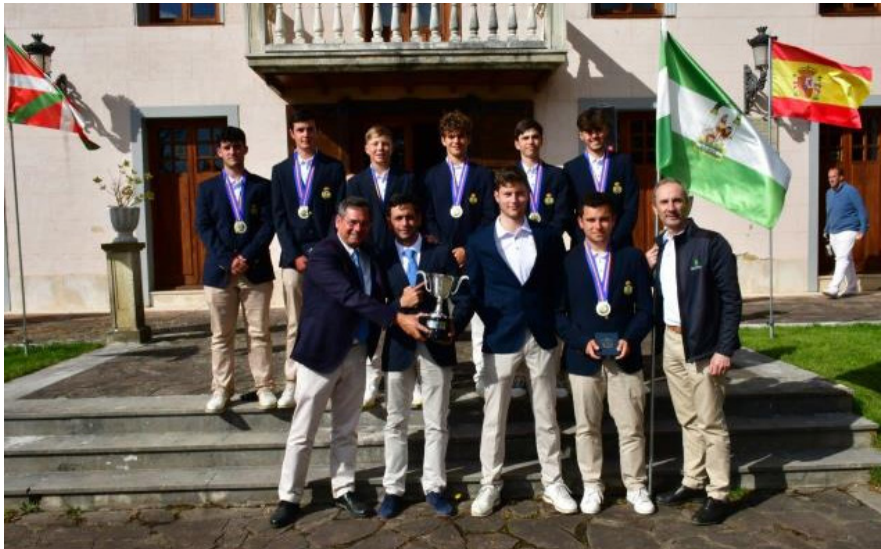
Cpto. de España FFAA Sub-18 Masculino

Andalucía se proclama Campeona, por 3 a 2 frente a Madrid.