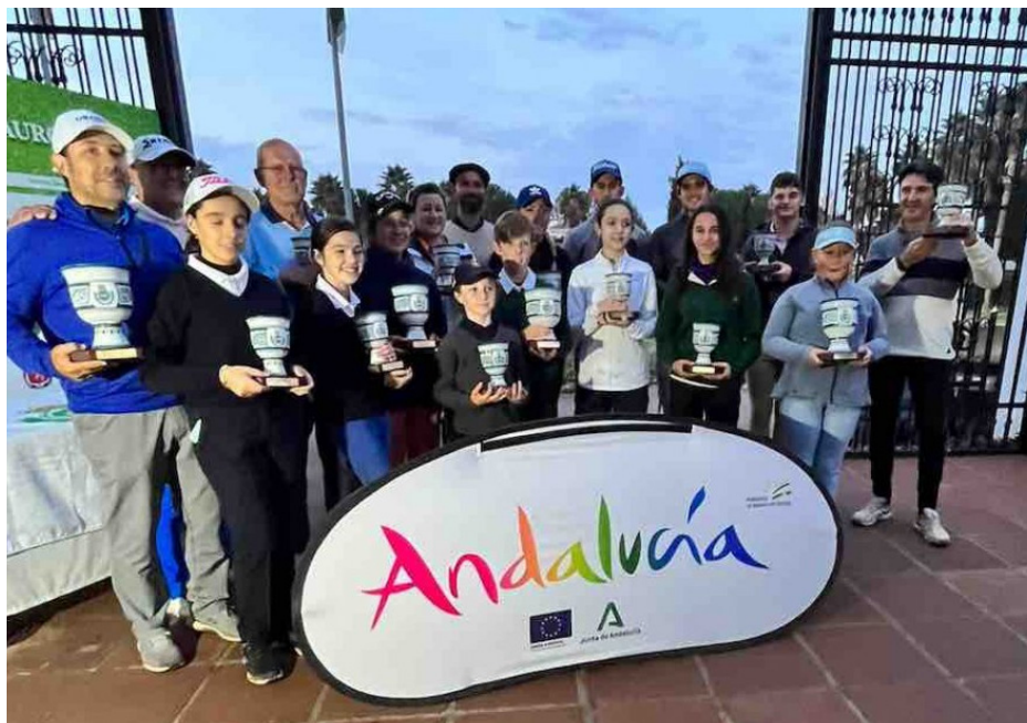
CTO. DE ANDALUCIA 2ª, 3ª Y 4ª CATEGORIA LAURO GOLF

COPA BALEARES: Celebrada en Pula Golf (Mallorca), del 7 al 10 de Diciembre. Participaron 90 jugadores, siendo los resultados obtenidos por los andaluces los siguientes: