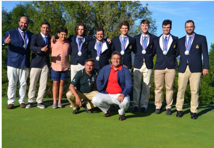
Cto. de España FFAA Absoluto Masculino Equipo Andalucía Subcampeones

El equipo andaluz se proclamó subcampeón frente a Madrid, por 4,5 a 2,5.