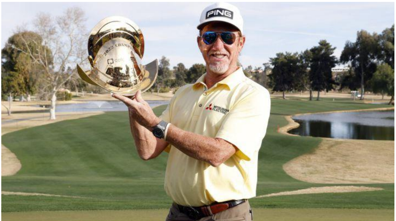
Miguel Ángel Jiménez, ganador del Cologuard Classic 2022