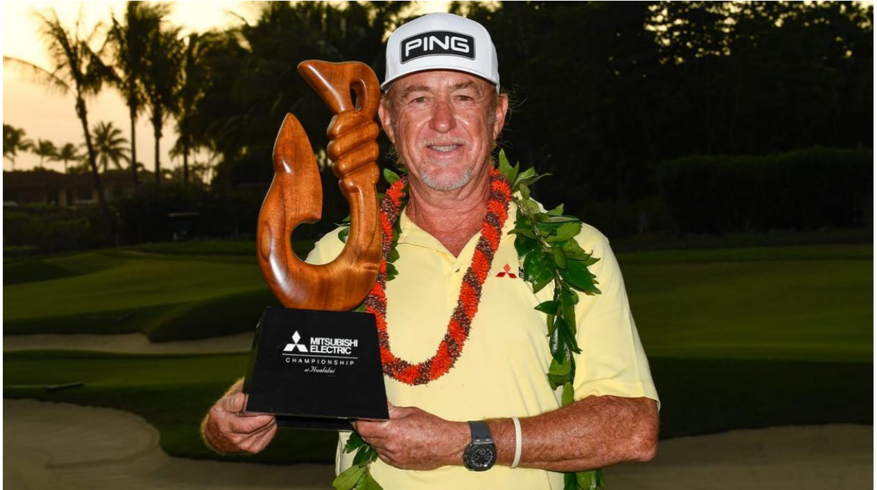
Miguel Ángel Jiménez, ganador del Mitsubishi Electric Championship at Hualalai 2022