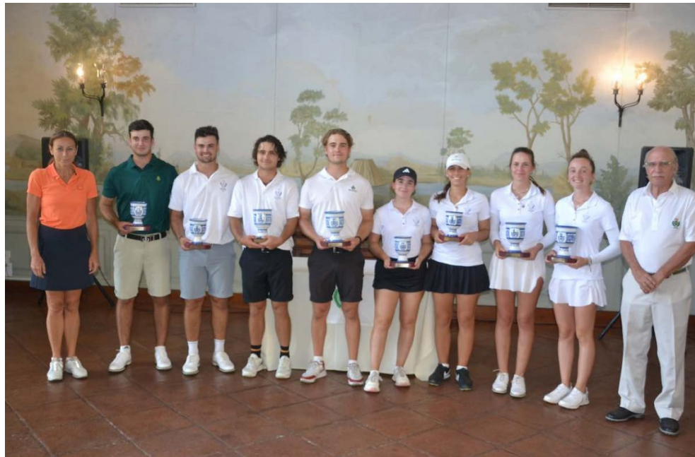
CTO. DOBLES DE ANDALUCIA SHERRY GOLF PRIMEROS CLASIFICADOS