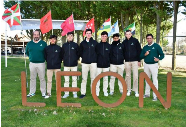
CTO. ESPAÑA FFAA SUB-18 MASCULINO EQUIPO RFGA CAMPEONES

Andalucía se proclama Campeona, por 6,5 a 2,5 frente a Cataluña, sumando cinco títulos.