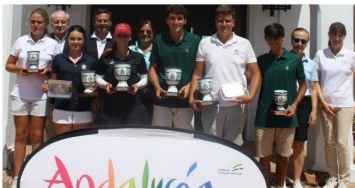
CTO. DE ANDALUCIA SUB-18 LA CAÑADA PRIMEROS CLASIFICADOS