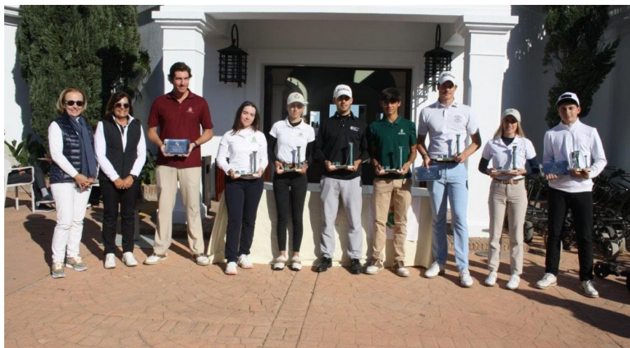
Trofeo Barbésula La Cañada Primeros Clasificados