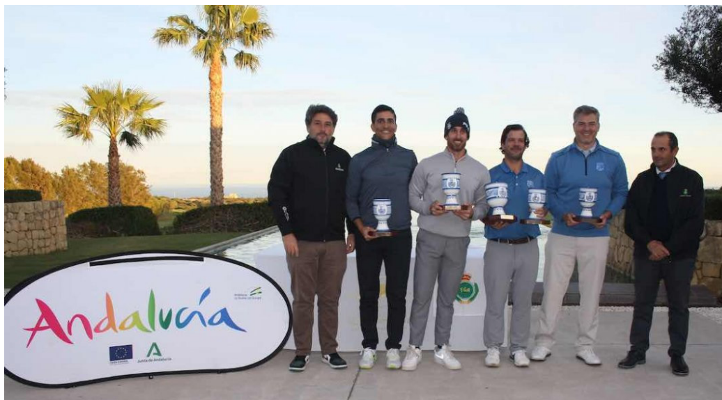
CAMPEONATO INTERCLUBES MASCULINO DE ANDALUCIA LA HACIENDA ALCAIDESA CAMPEONES-EQUIPO GOLF BELLAVISTA